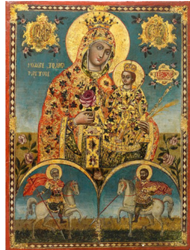
Icono de la Flor Inmarcesible (Siglo XVIII, Grecia)

-SAN JOHN HENRY NEWMAN (TRADUCIDO DEL INGLÉS)